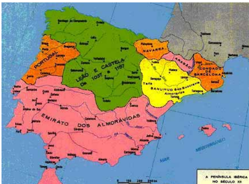
Figura 2 - O Império Almorávida na visão europeia: No mapa, o domínio ibérico dos almorávidas e os reinos cristãos da reconquista (ALBUQUERQUE, 1983:102)

Tendo este cenário como pano de fundo, é possível coletar representações cartográficas ocultando aspectos que de um modo ou de outro, atendem a pressupostos de um imaginário histórico-espaçial europeu. Um claro exemplo do que estaremos colocando sob discussão é o mapa da península ibérica durante o Século XII – tal como editado pelo Atlas Histórico Escolar – representando o Emirado dos Almorávidas e os reinos cristãos do período (Figura 2).