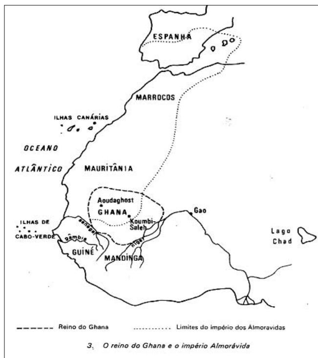
Figura 4 - O Império Almorávida numa visão africana (PAIGC, 1975:29)

Representação cartográfica voltada para revelar o papel da África na construção da sociedade moderna, esta carta nos mostra a extensão completa do espaço almorávida, assim como sua relação com o Ghana e outros marcadores espaciais da geografia africana, e em particular, com a densa rede hidrográfica, denunciando os contatos desse império com territórios ainda mais meridionais do continente.