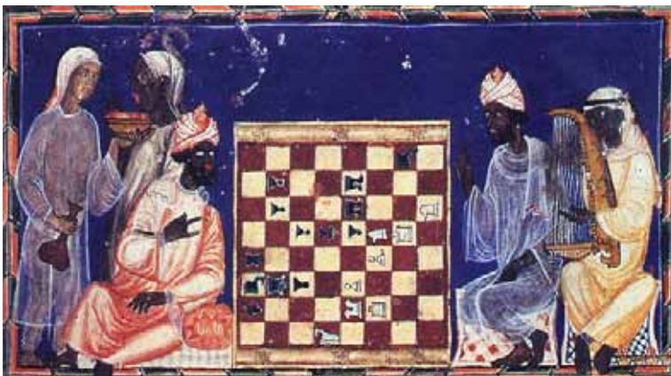
Figura 3 - Iconografia retratando “mouros negros” entretendo-se no Al-Andalus – Andaluzia