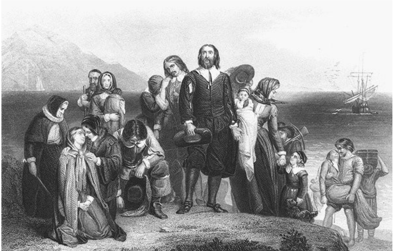
A chegada dos colonos puritanos é uma das mais festejadas alegorias da história norte-americana

Com base nestas premissas, a integração dos imigrantes com a sociedade local é imediata. O imigrante radica-se com sua família com a intenção de permanecer e não de retornar. Não ocorre o fenômeno do transoceanismo. A pretensão de construir uma nova pátria era indissociável do ideário dos colonos americanos, desdobrando-se, pois num nacionalismo precoce que ensaia suas manifestações já nos primeiros momentos da sua história.