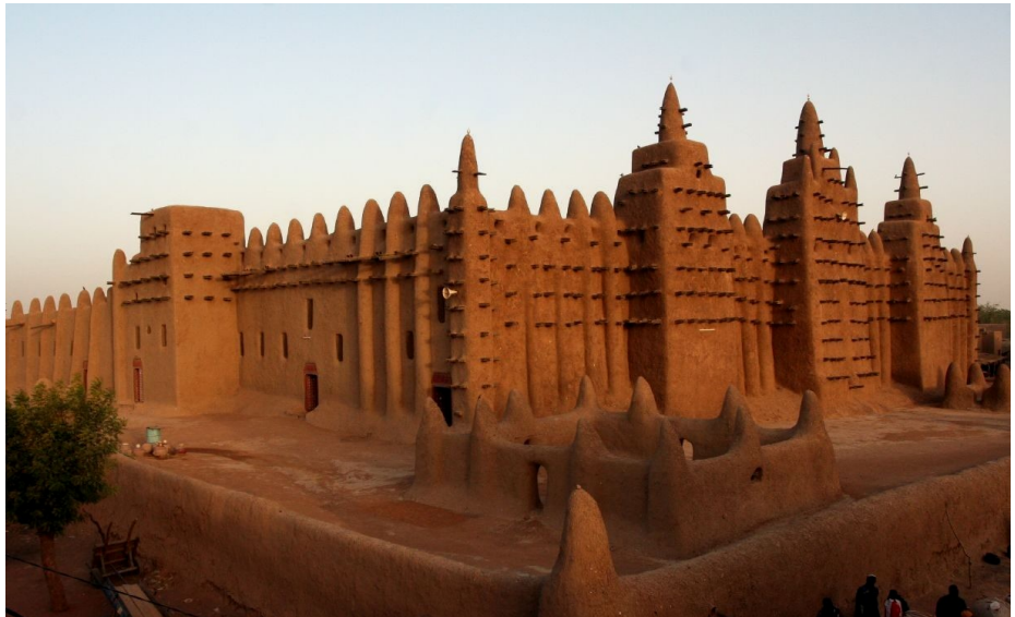
Mesquita de Timbuctu (Mali), construída com base em técnicas tradicionais de arquitetura de terra, típicas do Sudão Ocidental e em voga até os dias de hoje.

No que diz respeito à vida urbana, a arqueologia comprova uma antiga e florescente urbanização. A cidade de Djenné-Djeno, situada no vale do Níger, remonta, por exemplo, ao século III A.C., sendo que seus mercadores já transitavam desde os séculos V e VI ao longo dos espaços da savana sudanesa.