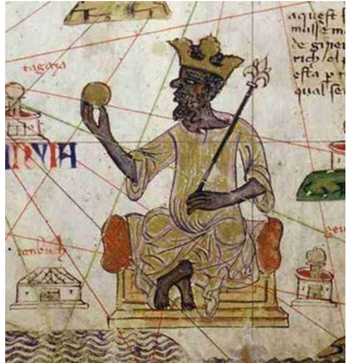
O Mansa do Mali , tal como retratado no famoso Atlas Catalão, obra do cartógrafo judeu Abraham Cresques (Séc. XIV). O Mansa segura nas suas mãos uma pepita de ouro, cercado de cidades e fortalezas.

E mais ainda, o quanto o passado dos povos do Terceiro Mundo pode constituir uma alavanca para repensar o presente, na direção de novas expectativas, anseios e esperanças!